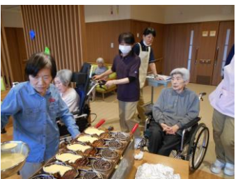
2月23日 たい焼き作り