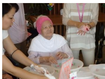
8月11日 洗顔セラピー